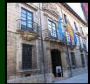
Museo de Bellas Artes de Asturias en Oviedo