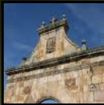
Casona de los Torres Quevedo: Arenas de Iguña