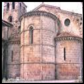
Monasterio de Cornellana