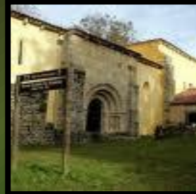
Iglesia de Abamia