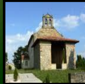
Iglesia de Santa María de Narzana