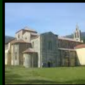
Monasterio del Valdedios en Villaviciosa