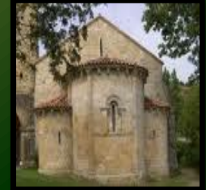
Iglesia Románica en Gobiendes