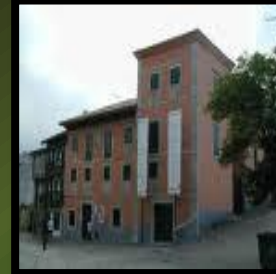
Casa de Cultura: Llanes