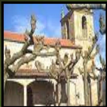
Iglesia de Rasines