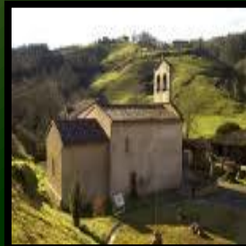
Iglesia San Julián de Viñón