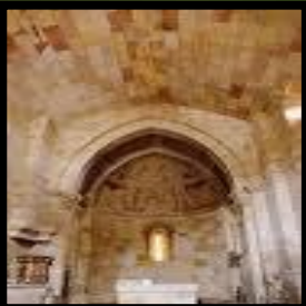
Iglesia San Cipriano y San Cornelio