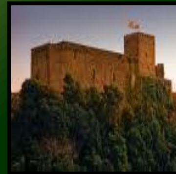
Castillo San Vicente de la Barquera