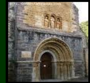
Iglesia Románica de Piasca