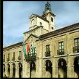
Capilla de los Salas: Avilés