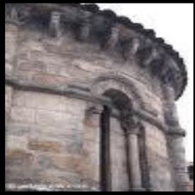
Abside capilla de Villamayor