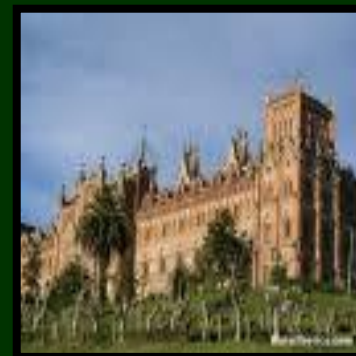
Universidad Pontificia de Comillas