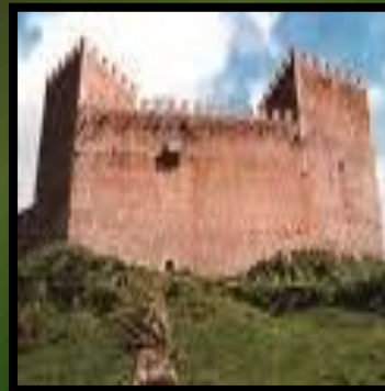
Castillo de Arugueso