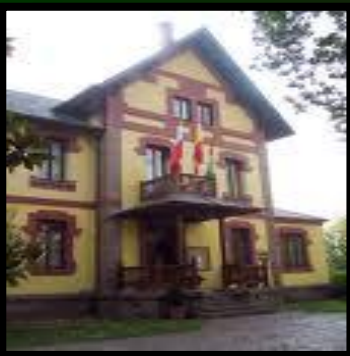
Casa cultura: Cabezón de la sal